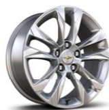
Колесные диски 17 X 7,5, легкосплавные, серебристые