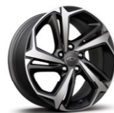
Колесные диски 18 X 7,5, легкосплавные, комбинированные