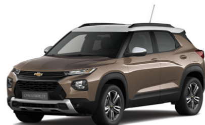
Zeus Metallic, коричневый металлик