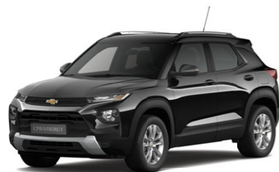
Black Meet Kettle Metallic, черный металлик