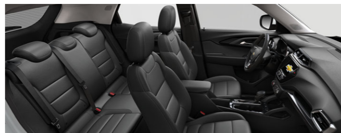
Обивка сидений из экокожи черного цвета