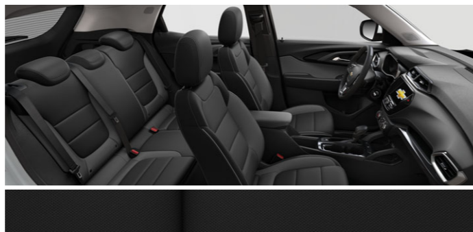
Обивка сидений тканью черного цвета