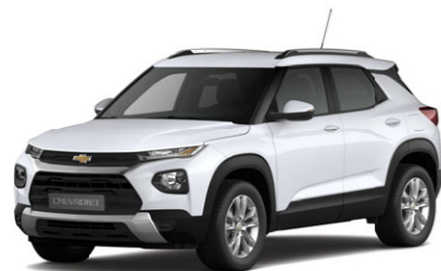
Summit White, белый