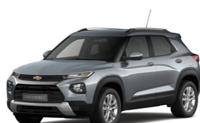
Satin Steel Gray Metallic, серый металлик